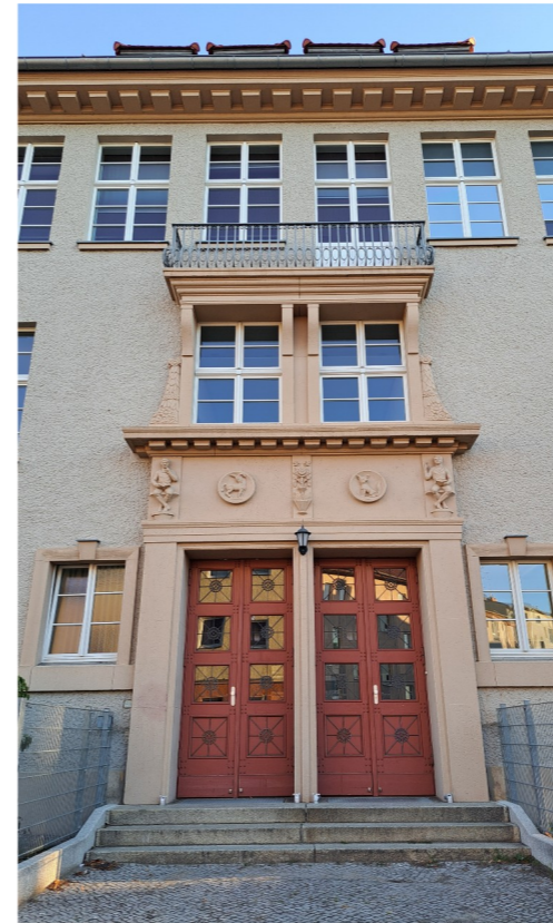
Während Sellheim- und Goetheschule Oberschulen mit angeschlossener Grundschule sind (bis Klasse 10) wird im Humboldt- und Finow-Gymnasium von Klasse 7-12 bis zum Abitur unterrichtet. Grundschule Finow, Schwärzeseeschule und Bruno-H.-Bürgel-Schule (nicht im Bild) haben nur erste bis sechste Klassen.