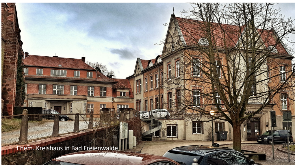
Ehem. Kreishaus in Bad Freienwalde